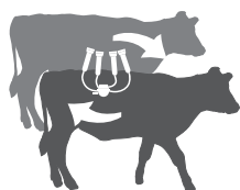
Fómites (objetos inanimados contaminados)

Las aves acuáticas y otras aves pueden excretar el virus de la IAAP en sus secreciones orales, nasales y fecales.